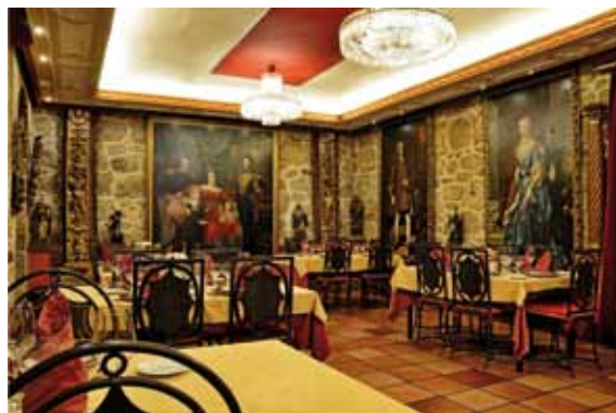
Salón "DE REYES"