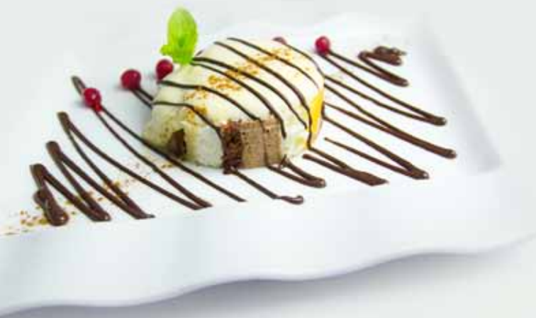
Tarta DE LAS MONJAS